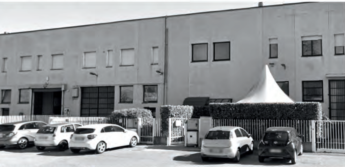
Assago - Via Concordia 3

Questi passaggi non solo testimoniano l'adattamento dell'azienda alle nuove esigenze del mercato, ma anche l'impegno costante verso l'innovazione e il miglioramento continuo. Ogni nuova sede rappresenta un'opportunità per ampliare le capacità logistiche, ottimizzare le operazioni e fornire un servizio sempre migliore ai clienti.