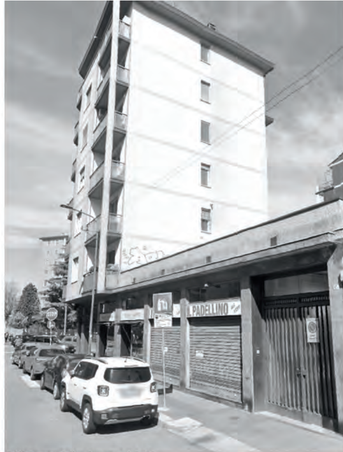
Milano - Via Imperia 11