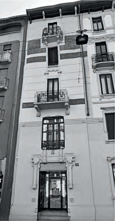
Milano - Via Gustavo Modena 2